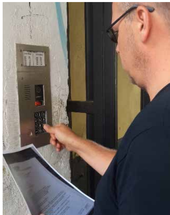
FNV - Stichting VNB belt aan bij het "hoofdkantoor" van De Rooy Poland in Warschau.