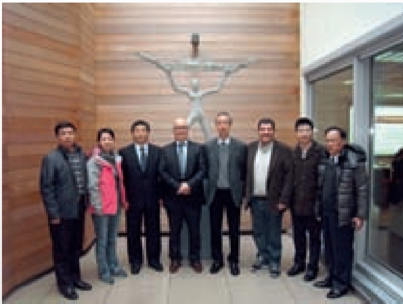
■ Het groepsskiekje aan het monument in het BTB hoofdkwartier.

Hoofdmoot in het programma was een bezoek aan Antwerpen. Gezien de vele raakpunten tussen belangrijke