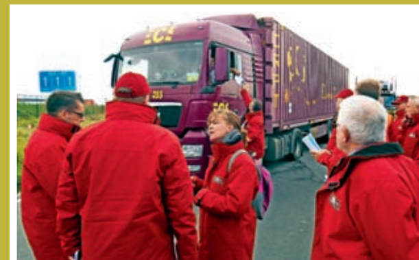
■ Ook in de haven van Zeebrugge wordt tijdens de actieweek de nadruk gelegd op veiligheid in en rond containers.