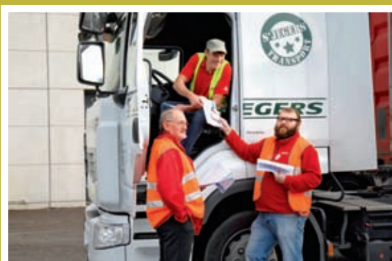
■ BTB promoot campagne 'Container Safety Now' in Meerhout