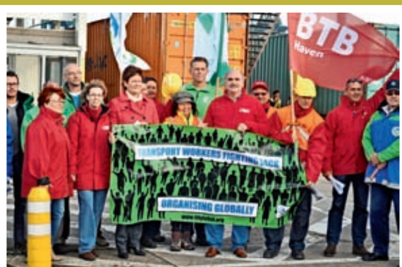
■ Sensibiliseringsactie rond veiliger containertransport in de haven van Antwerpen